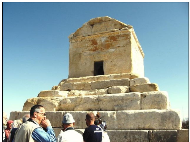
Grobnica kralja Kira Vel. (*okr. 600 pr. n. št. + 529 pr. n. št.)

Petek ali muslimanska nedelja nam je omogočil praznično razpoloženje z ogledom največjega umetniškega