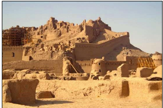
Citadelo Arg-Bam obnavljajo po katastrofalnem potresu 26. decembra 2003

Naslednji dan smo se zgodaj zjutraj odpeljali na letališče, od koder smo poleteli proti jugovzhodu države, natančneje v Kerman. Ker je šlo za notranji let, so mo-