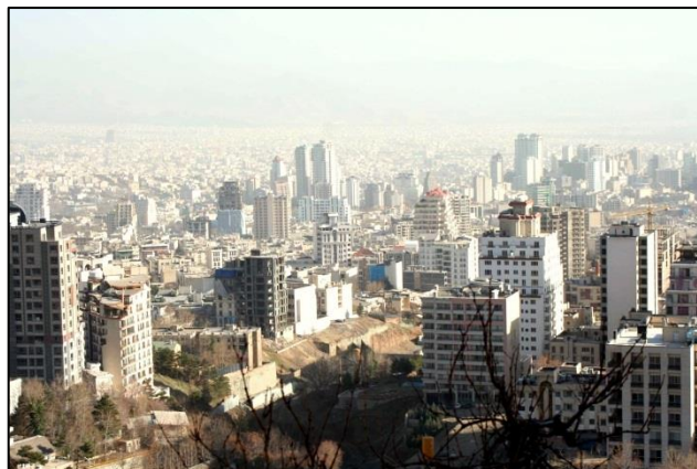
Pogled na Teheran, glavno mesto Irana