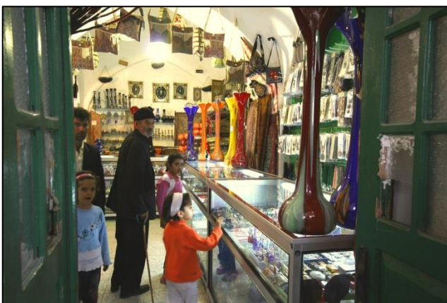
Bazar je bil po dobri založenosti prava paša za oči

Ko smo se vrnilo z gore, smo pred večerom ujeli utrip bazarja z nenavadno gnečo. Nismo pričakovali tako modernega zahodnjaškega »trgovskega centra«, pa