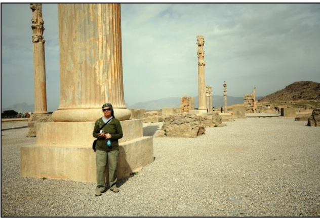
Leta 512 pr. n. št. je Perzepolis začel graditi Darej I

Isfahan je predstavljal vrhunec našega potovanja po