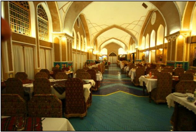
Hotel Mashir je zgrajen po zgledu stare perzijske arhitekture

Iz radovednosti smo si v stari meščanski hiši z notranjim vrtom ogledali tehniko hlajenja z vodo. Hiša je muzejsko urejena; poleg slik so razstavljeni nekateri pripomočki z maketami vodne napeljave, kanalov in rezervoarjev. Za dopolnilo smo si ob zahajajočem soncu v daljavi ogledovali še zračni stolp.