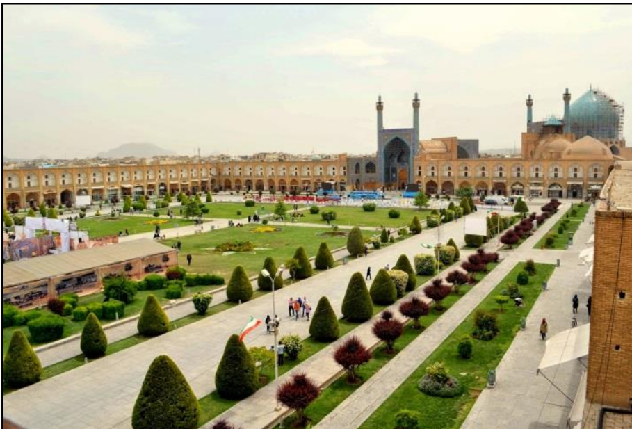
Pogled na osrednji del znamenitega Imamovega trga v Asfahanu

Spet smo prispeli domov, obogateni z lepimi vtisi na prijazen Iran.