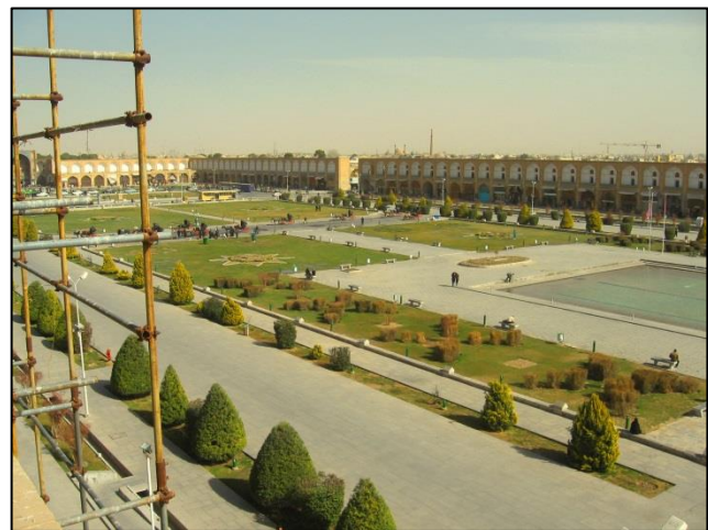
Imamov trg, velik 525 m x 160 m, leži v središču mesta Isfahan

Voznika avtobusa, oče in sin, sta bila nekaj posebnega. Oblečena sta bila v lepe uniforme, postavna in prijazna, na poti sta nam kuhala čaj in kavo. Tudi avtobus je bil vedno skrbno očiščen ter opremljen z novimi vrečkami za odvečno embalažo in smeti. Vodič Mustafa pa