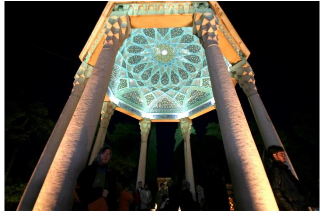
Znamenje ob mavzoleju znamenitih pesnikov Sadija in Hafeza

V dveh dneh, ki smo ju preživeli v tem lepem mestu, smo si ogledali tudi nihajoča minareta, ki stojita ob