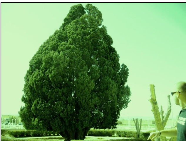
Po oceni strokovnjakov je ta cipresa stara 4500 do 5000 let

Med nadaljnjo vožnjo v Abr Kud smo se ustavili pri naj-