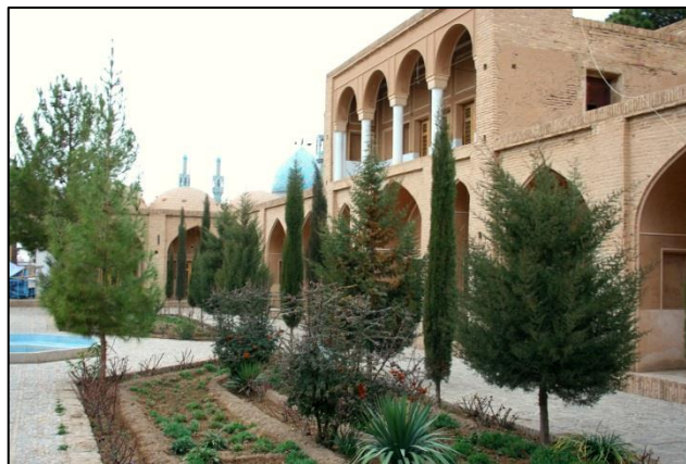
Mavzolej sufijskega šaha, pesnika in modreca Ne'emmat Ollah-e-Valija

Po prihodu v Yazd smo se na robu mesta najprej povzpeli na goro tišine, kjer so nekoč Zoroastri umrle pokopavali tako, da so mrliča na vrhu ne preveč visoke gore izpostavili pticam. Oblasti takega pokopavanja ne dovolijo več. Pod goro tišine smo si ogledali še ostanke