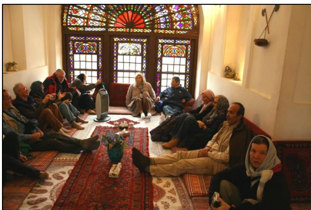
Po ogledu princesinega vrta Bagh-e-Skadarek smo znotraj čudovite palače podoživljali lepoto tega kraja

Naslednji kulturni biser smo si ogledali v mestu Mahan, glavnem mestu okrožja Mahan v provinci Kerman. Mahan privablja obiskovalce v vrtove, kjer je čudovita palača z mavzolejem sufijskega šaha, pesnika in modreca Ne'emmat Ollah-e-Valija, ustanovitelja reda dervišev. Mavzolej slovi po kupoli in keramičnih ploščicah, ki očarajo človeka. Osrednjo kupolo grobnice oziroma mavzoleja je leta 1437 dokončal šah Ahmad Bahmani, kralj Deccana in eden izmed najzvestejših učencev Ne'emmat Ollah-e-Valija.