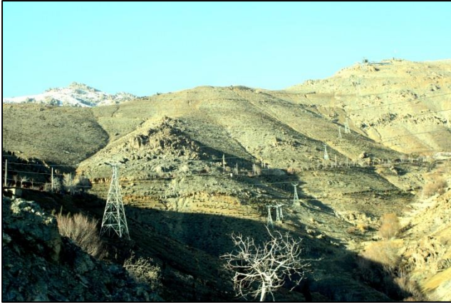
V nevidnem ozadju gorovja Elbrusa je Damavand, visok 5671 m

še druga stavba sta spremenjeni v muzej neprecenljive umetnosti.