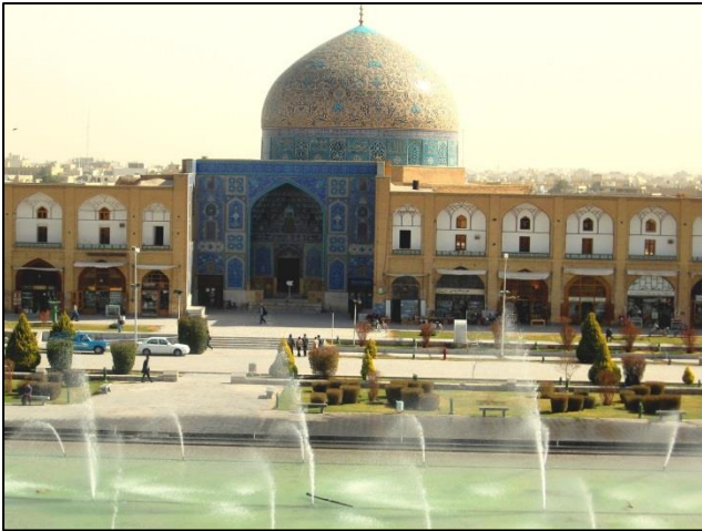
Mošeja šejka Lotfolaha (1603-1619)