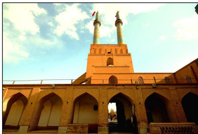
Petkova mošeja z dvema čudovitima minaretoma iz dvanajstega stoletja

Stari del mesta Yazd je po arhitekturi edinstven kraj, ki je dobro ohranjen, poseben čar pa mu daje mešanica kultur. Večina hiš je zgrajenih iz zidakov posušenega blata in s strešnimi hladilnimi jarki, kot nekoč pa izkoriščajo vsako sapico za hlajenje stanovanj. Povprečna julijska temperatura v mestu znaša 27,5 °C (podnevi 33 °C, ponoči 22 °C), zato se mesto v tem mesecu in ostalem delu poletja zelo segreje.